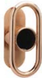
Wall og Ellipse slangesaddel