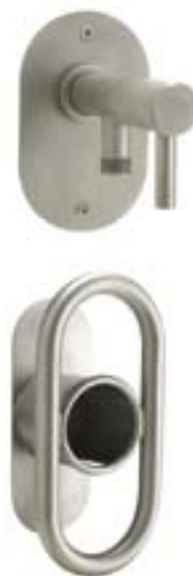
Wall og Ellipse slangesattel